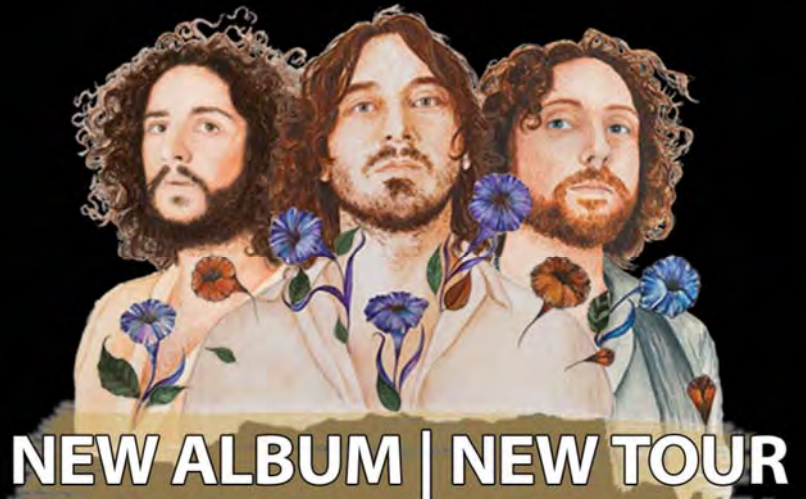
NEW ALBUM | NEW TOUR