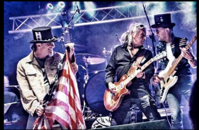
Tribute to LYNYRD SKYNYRD